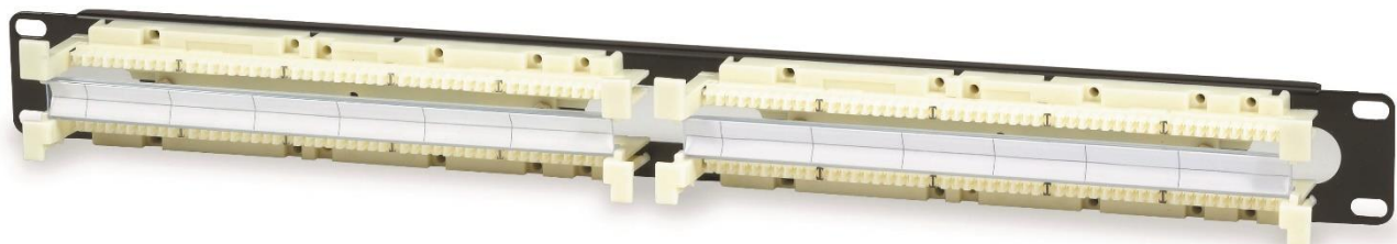
Рисунок 2. Монтажно-габаритные размеры коммутационной панели RWBK-100PR4