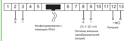
Рис. 1. Схема электрических соединений для приборов N25S