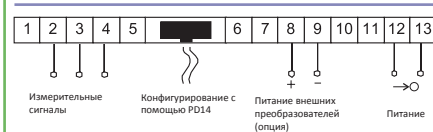
Рис. 2. Схема электрических соединений для приборов N25T