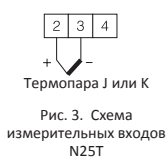
Рис. 3. Схема измерительных входов N25T